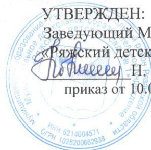
ГРАФИК проведения специальной оценки условий труда на рабочих местах